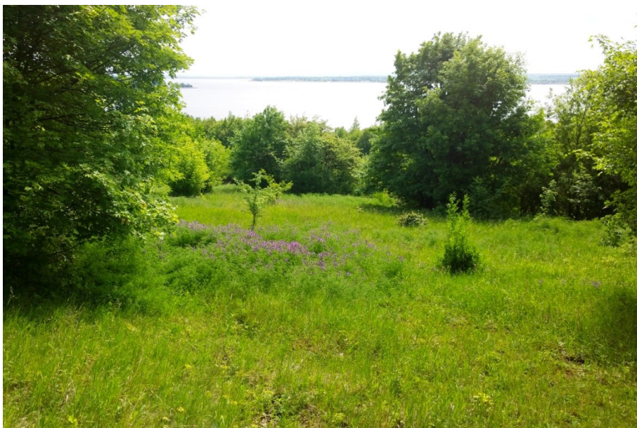
Obr. 7. / Fig. 7. Běšický chochol.