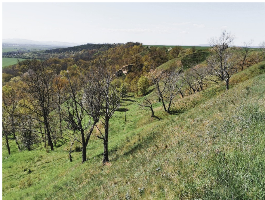
Obr. 11. / Fig. 11. Stroupeč.