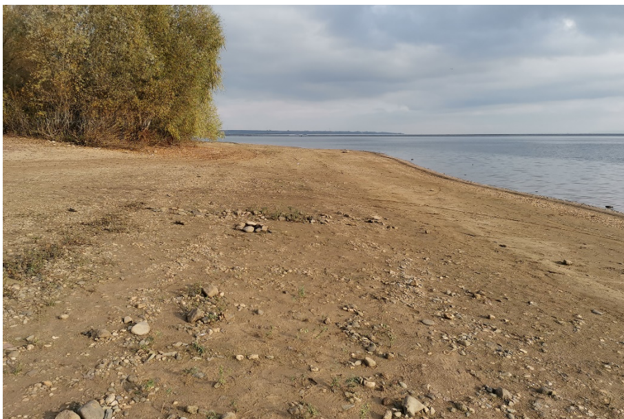
Obr. 9. / Fig. 9. Nechranická přehrada po částečném vypuštění. Fig. 9. Reservoir Nechranice after partial water discharge.