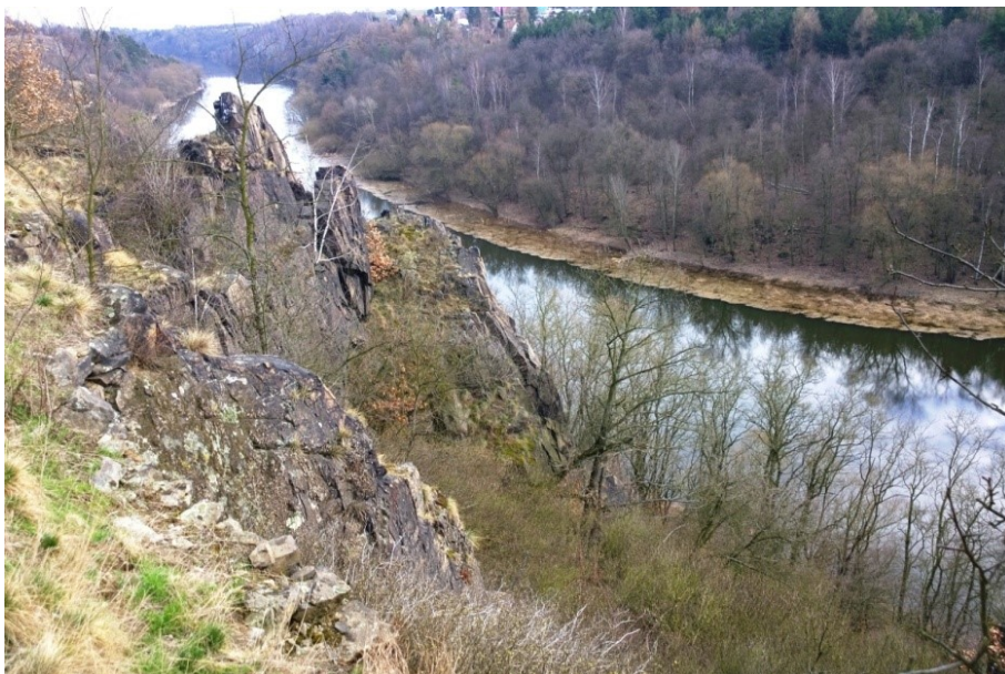
Obr. 6. / Fig. 6. Želinský meandr.