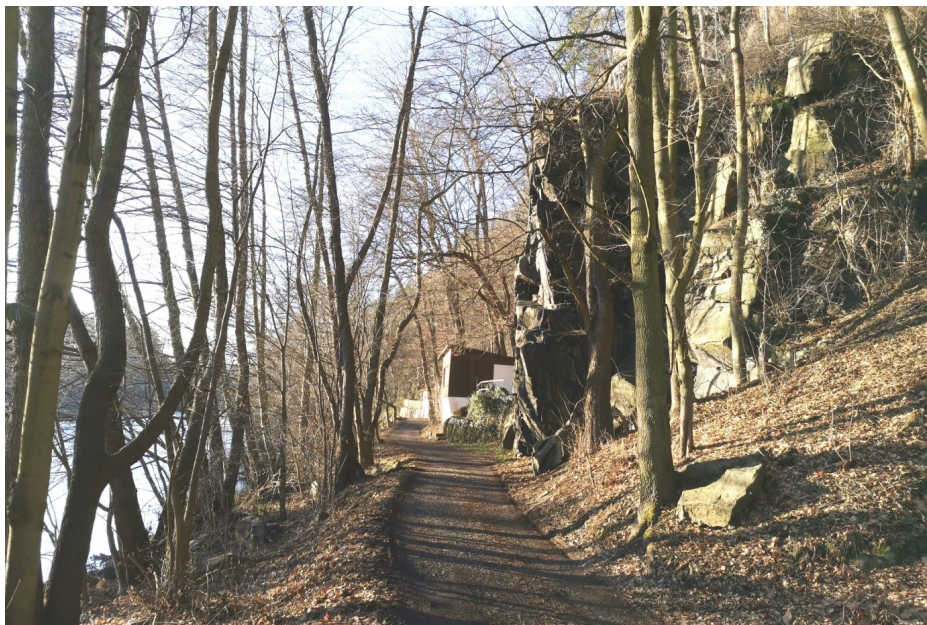
Obr. 4. / Fig. 4. Ohřecká louka.