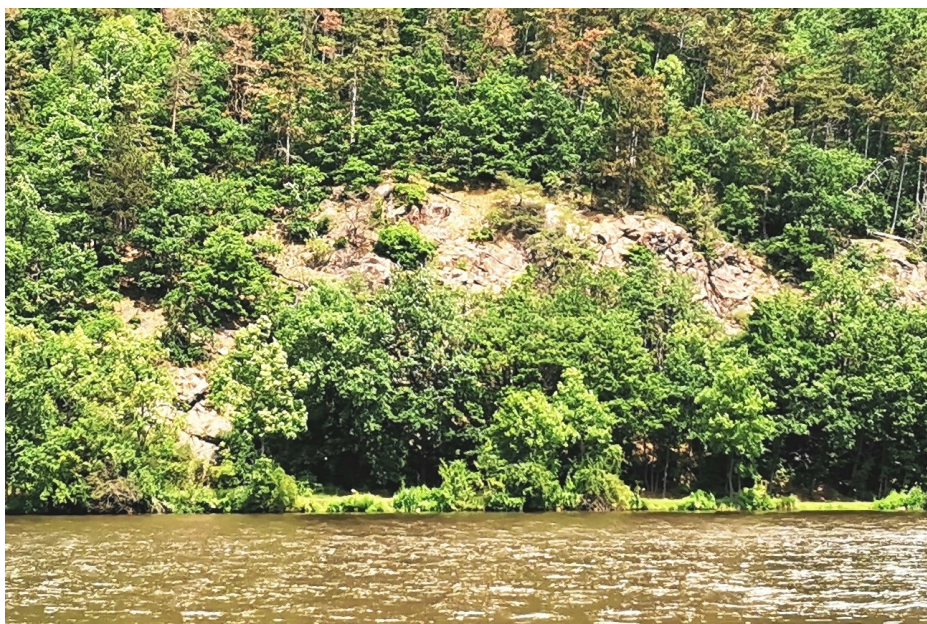
Obr. 5. / Fig. 5. Martiusovy skály.