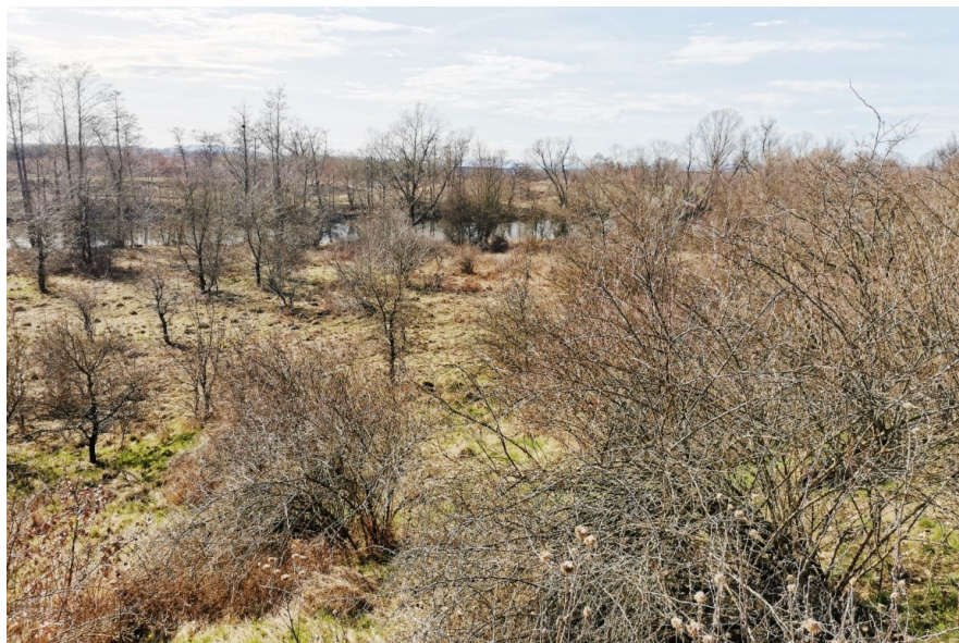
Obr. 10. / Fig. 10. Stranná.