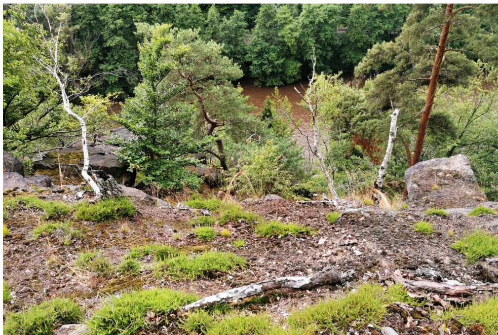
Obr. 3. / Fig. 3. Boč.