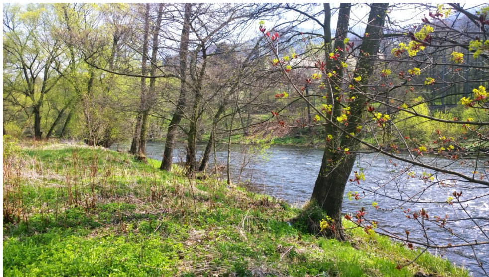
Obr. 2. / Fig. 2. Stráž nad Ohří.