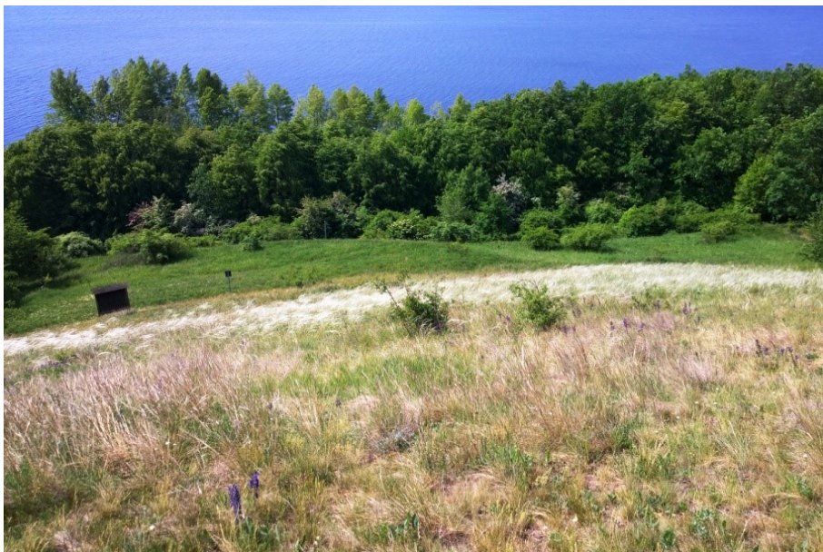
Obr. 8. / Fig. 8. Čachovický vrch.