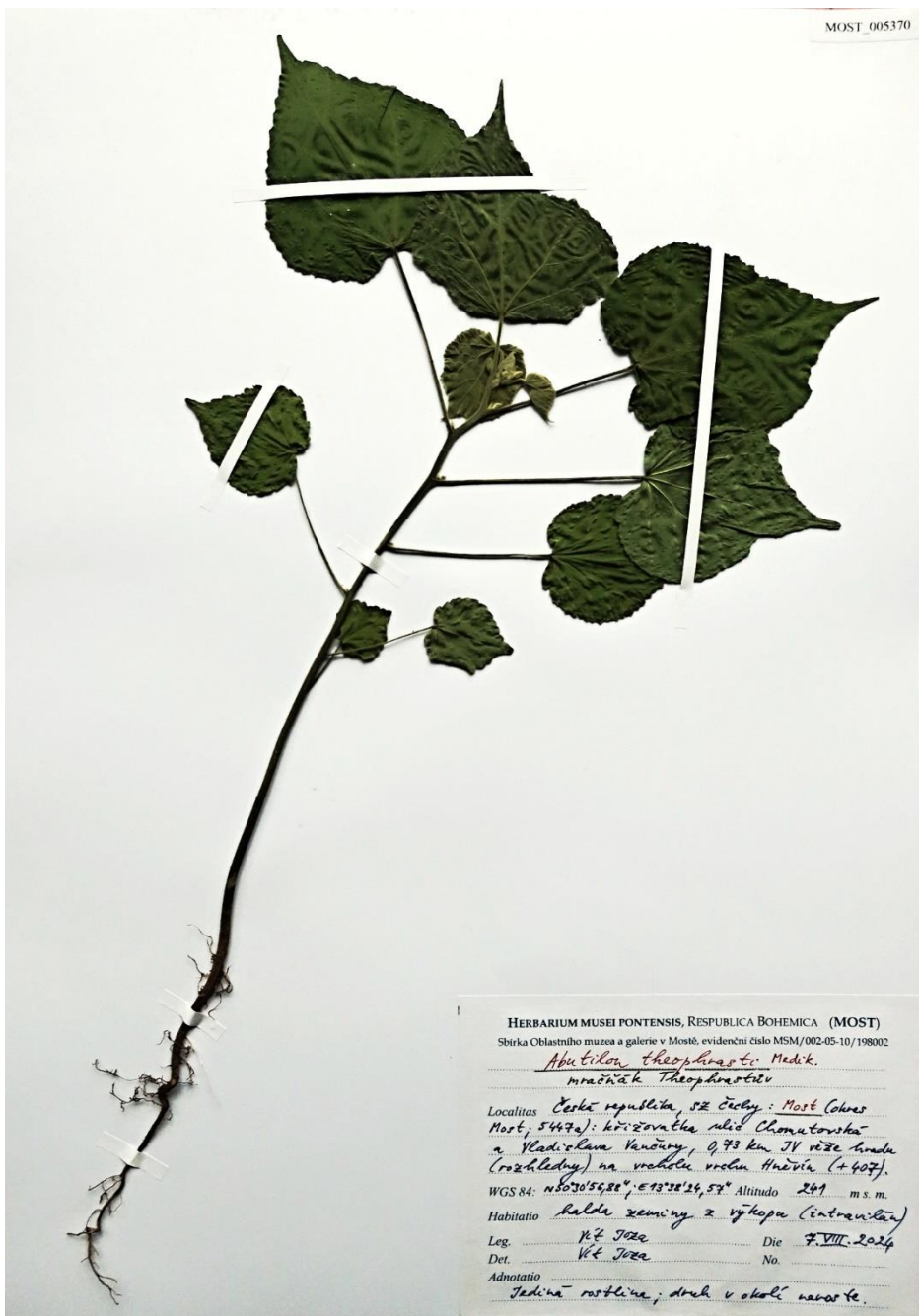
Obr. 1 / Fig. 1.