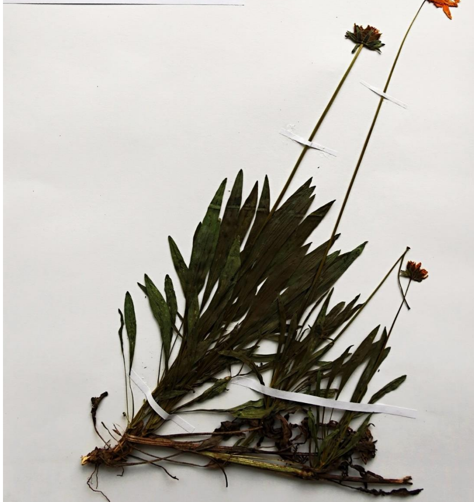
Obr. 2 / Fig. 2.

Adnotatio 1 státny zplněný trs, v okolí nebyl tento druh současně pěstován.