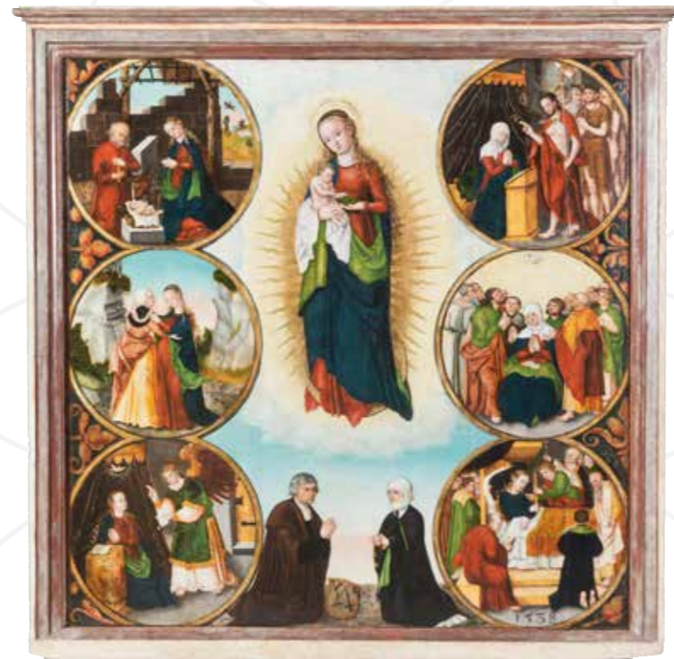
Meister I. W., Votivtafel aus Most , datiert 1538, Ölmalerei auf Fichtenholz, Oblastní muzeum a galerie v Mostě

Öffnungszeiten: Di–Fr 9–17 Uhr, Sa 13–17 Uhr Die Ausstellung ist in Form einer virtuellen Besichtigung zugänglich. Texte © Jitka Šrejberová, 2021 Typo © Marek Jodas, 2021 © Ústecký kraj, 2021 www.kr-ustecky.cz ; www.muzeumchomutov.cz ; www.muzeummost.cz