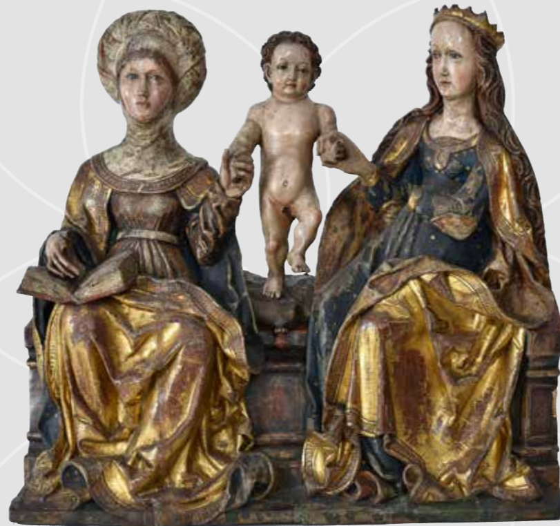
Hl. Anna Selbdritt aus dem Museum in Ústí nad Labem , zweites Jahrzehnt des 16. Jahrhunderts, Holz, polychromiert, Museum města Ústí nad Labem