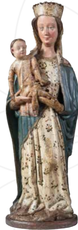
Madonna aus Krupka II. , 1450–1460, Pappel, polychromiert, Regionální muzeum v Teplicích