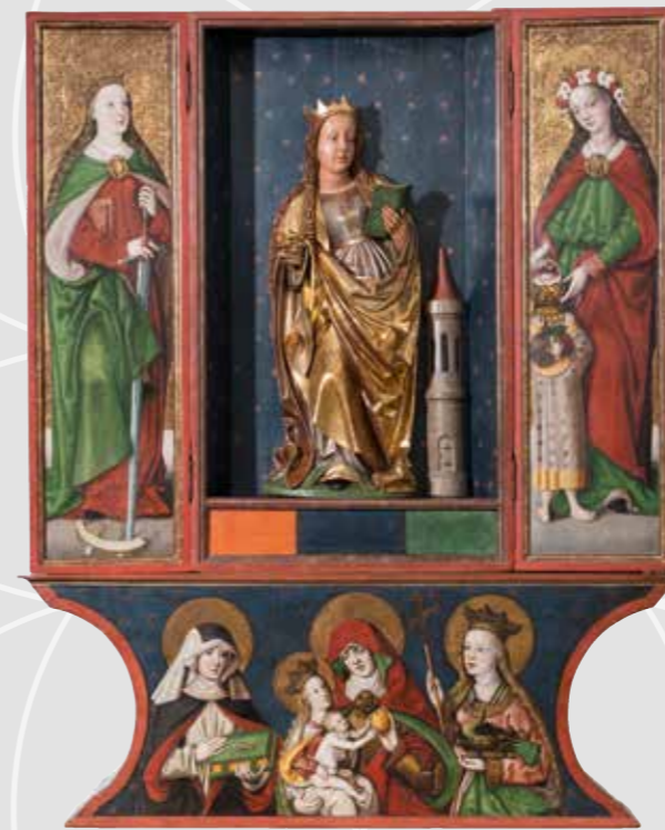
Hans Hesse (Malereien) und ein Bildhauer der fränkisch-schwäbischen Schulung, Retabel mit der Hl. Barbara , Malereien vor 1513, Skulptur 1500–1510, Temperafarbe auf Fichtenholz, vergoldet, Skulptur Lindenholz, polychromiert, Oblastní muzeum v Chomutově