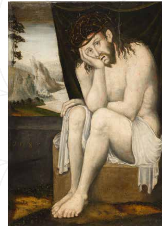
Meister I. W. – Kopist, Christus in der Rast , datiert 1585, Öltemperafarbe auf Holz, Regionalmuseum in Chomutov