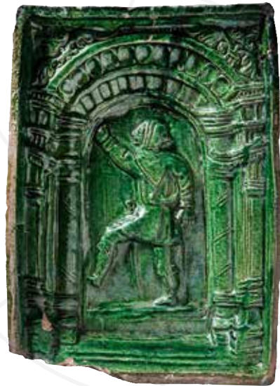
Bergmannsfigur in der Nische , erstes Viertel des 16. Jahrhunderts, gebrannter Lehm, glasiert, Regionální muzeum v Teplicích

Die Ausstellung wird in Zusammenarbeit der Region Ústí mit dem Regionalmuseum in Chomutov, im Ausstellungssaal im Alten Rathaus, vom 5. Februar 2021 bis zum 18. April 2021 veranstaltet. Die Ausstellung ist das Hauptergebnis des deutsch-tschechischen Projektes Spätmittelalterliche Kunst in der Montanregion Erzgebirge , Reg.-Nr. 100289027, das aus dem Kooperationsprogramm zur Förderung der grenzüberschreitenden Zusammenarbeit zwischen dem Freistaat Sachsen und der Tschechischen Republik 2014–2020 finanziert wird.