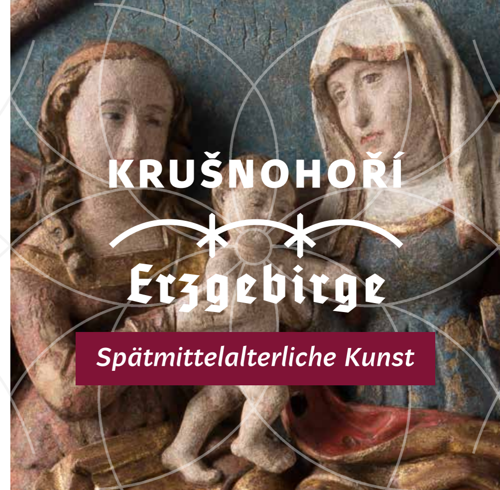
einer Anna Selbdritt-Gruppe , 1530, Linden(?)holz, polychromiert, Oblastní muzeum a galerie v Mostě