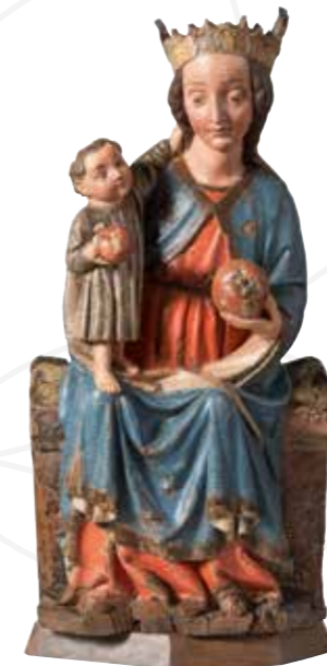
Trůnící Madona I. , 1410–1420, topolové dřevo, polychromováno, Oblastní muzeum a galerie v Mostě

Na titulní straně Tondo se sv. Annou Samotřetí , 1530, lipové (?) dřevo, polychromováno, Oblastní muzeum a galerie v Mostě